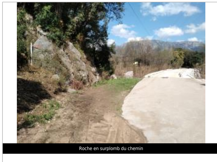
Roche en surplomb du chemin