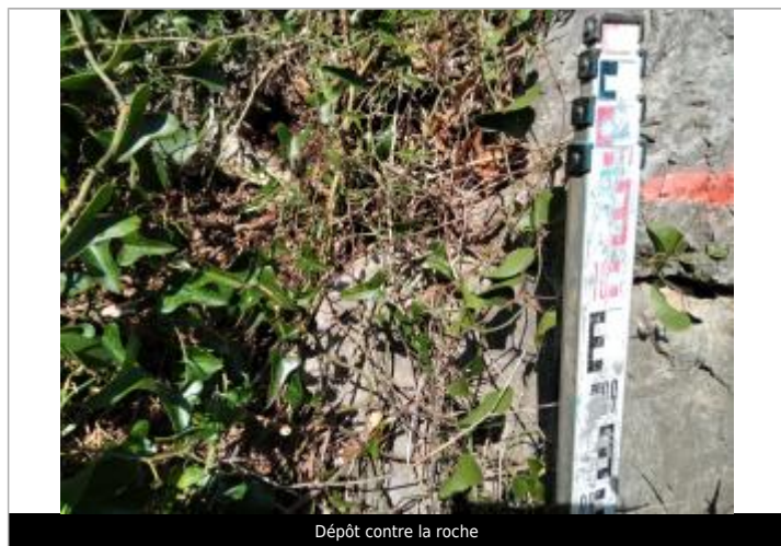
Dépôt contre la roche

Maximum de l'inondation : Oui Visibilité : Non renseigné État du repère : Non renseigné Pérennité : Non renseigné Repère calculé : Non renseigné PHEC : Non renseigné