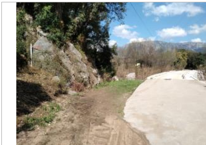
Roche en surplomb du chemin