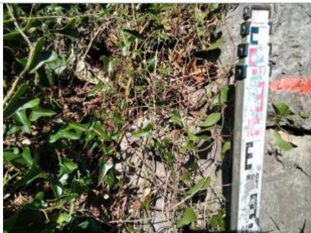
Dépôt contre la roche

Altitude calculée de l'eau (en m) : 115.416