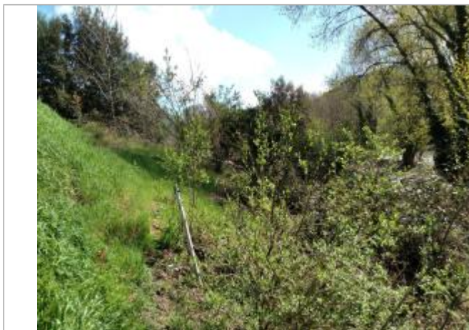
Talus sous la vigne

Coordonnées WGS84 : X: 2.96769180 / Y: 43.53846340