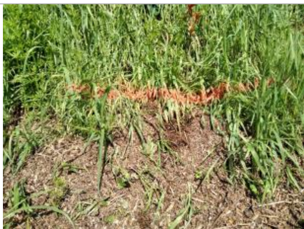
Dépôt contre le talus