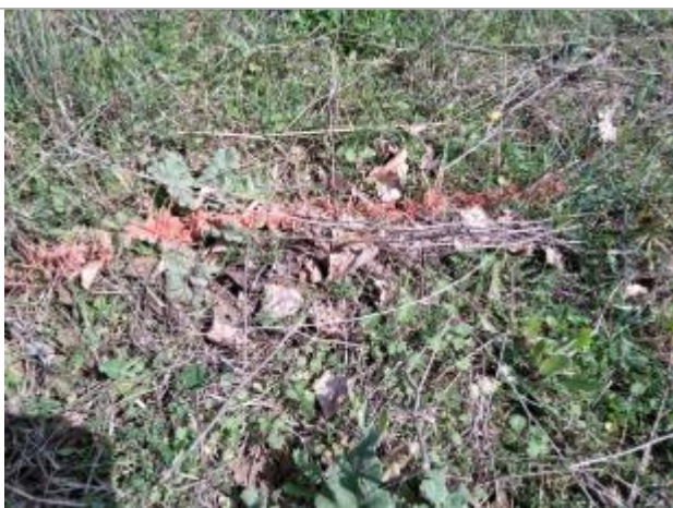
Dépôt au sol

Altitude calculée de l'eau (en m) : 108.32