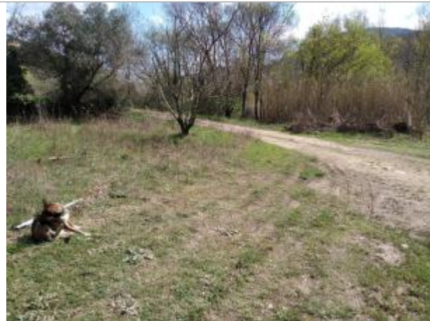
Bord de chemin, entre les cerisiers