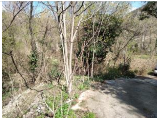
Chemin bétonné d'accès