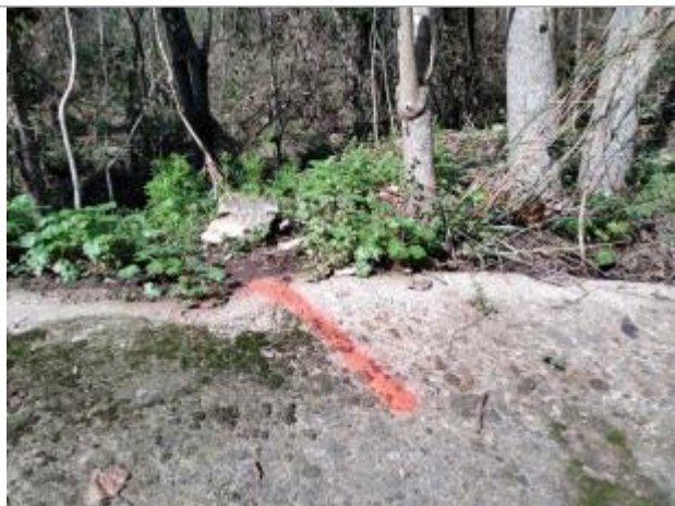
Dépôt en bord de chemin, reporté sur le béton

Altitude calculée de l'eau (en m) : 106.55