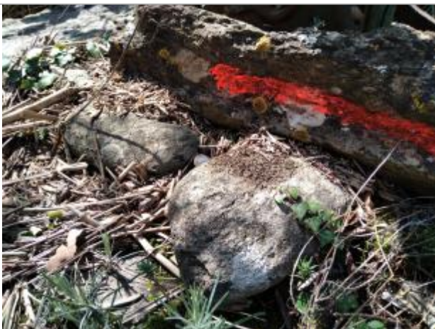
Dépôt sur le puits