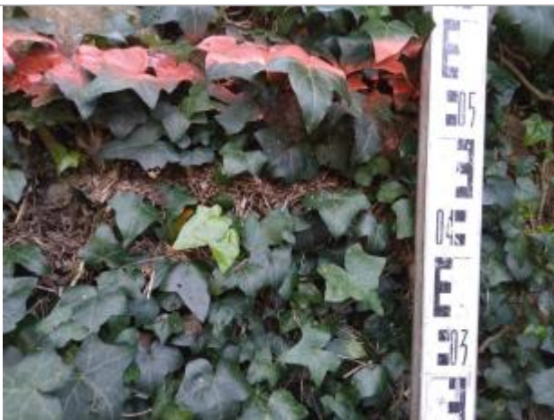
Trace sur le mur en pierre du chemin