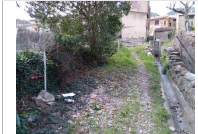
Chemin d'accès aux potagers

Coordonnées WGS84 : X: 2.99038700 / Y: 43.51355460