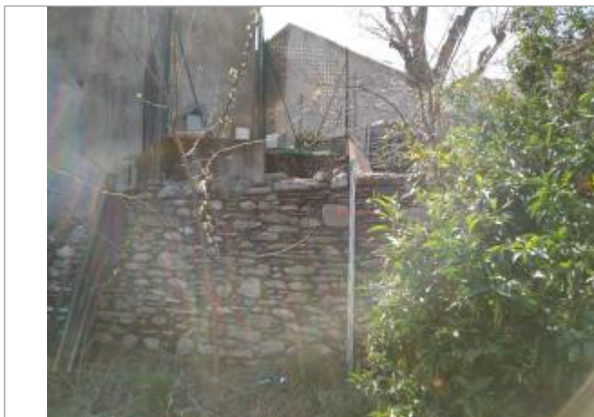
Mur sous le poste de refoulement