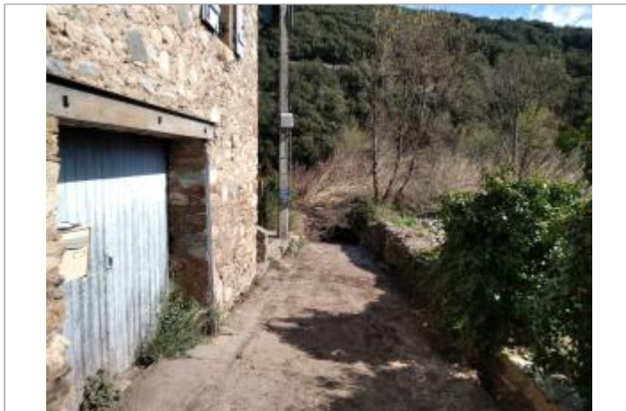
Portail de garage