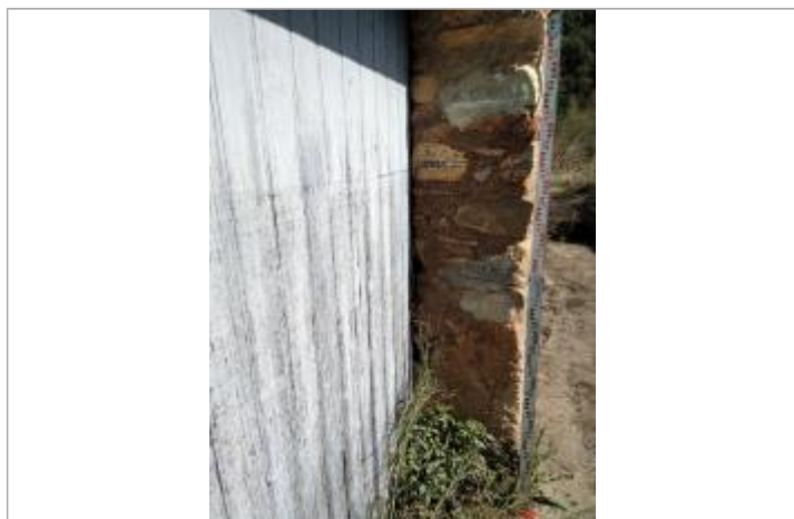
Trace sur le portail et marque sur le montant 25cm sous 1953

Altitude calculée de l'eau (en m) : 93.737