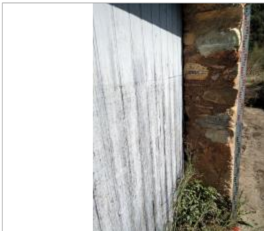
Trace sur le portail et marque sur le montant 25cm sous 1953