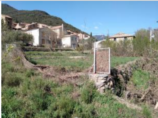
Portillon du potager