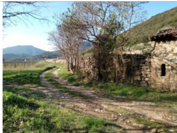
Mur de soutènement à côté du mazet