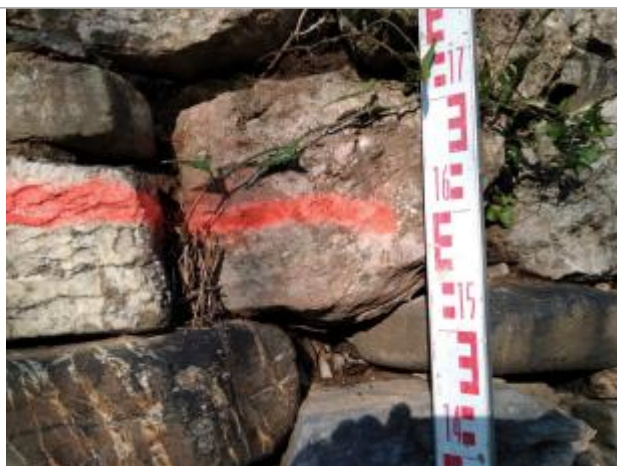
Dépôt entre les pierres

Altitude calculée de l'eau (en m) : 89.13