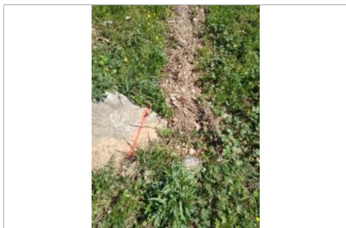
Dépôt contre le talus reporté sur un rocher

Code : 23_ORB22_R_436_1 Date de mise à jour : 26/04/2023