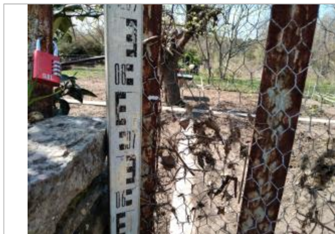
Débris végétaux dans le portillon

Altitude calculée de l'eau (en m) : 78.087