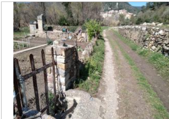
Portillon du potager