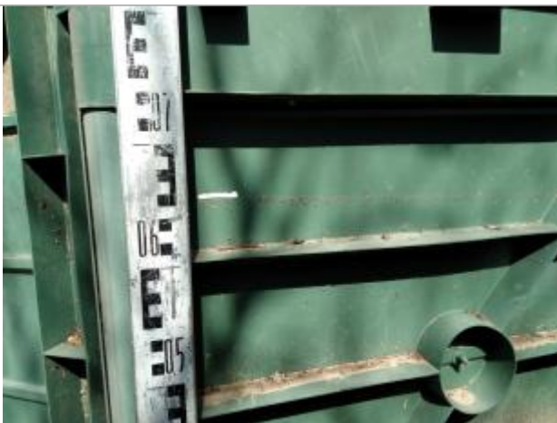
Trace dans le composteur

Altitude calculée de l'eau (en m) : 77.85