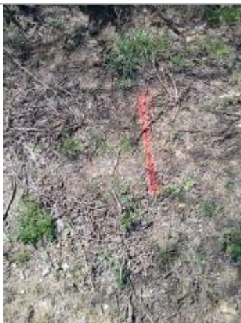
Dépôt au sol