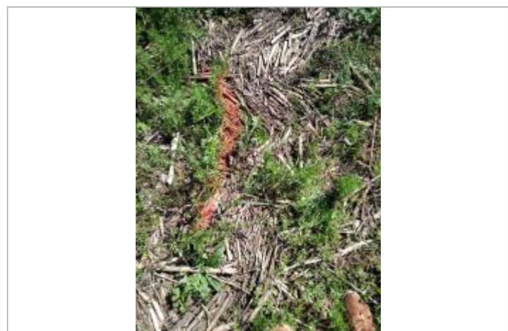
Dépôt en haut de berge

GÉNÉRAL Code : 23_ORB22_R_419_1 Date de mise à jour : 26/04/2023 Auteur : SPC MO