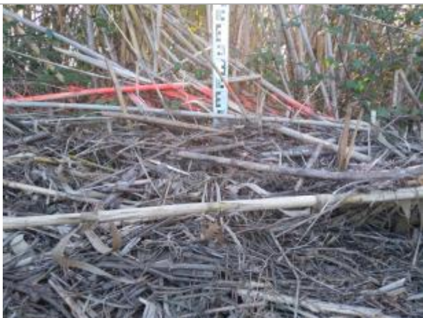
Dépôt contre les cannes de Provence