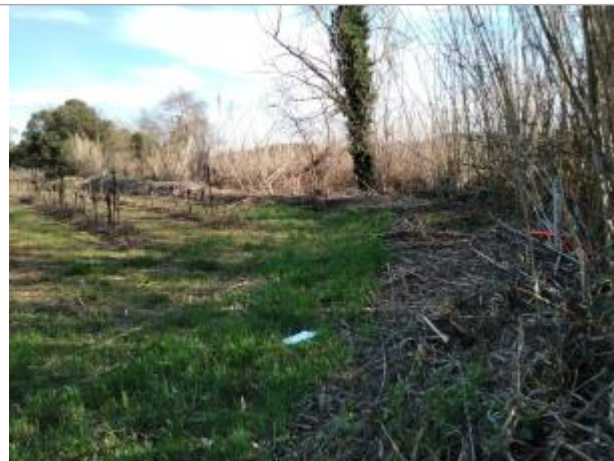
Cannes de provence

Coordonnées WGS84 : X: 3.02899450 / Y: 43.46429290