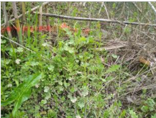
Dépôt contre les cannes de Provence

Altitude calculée de l'eau (en m) : 25.76