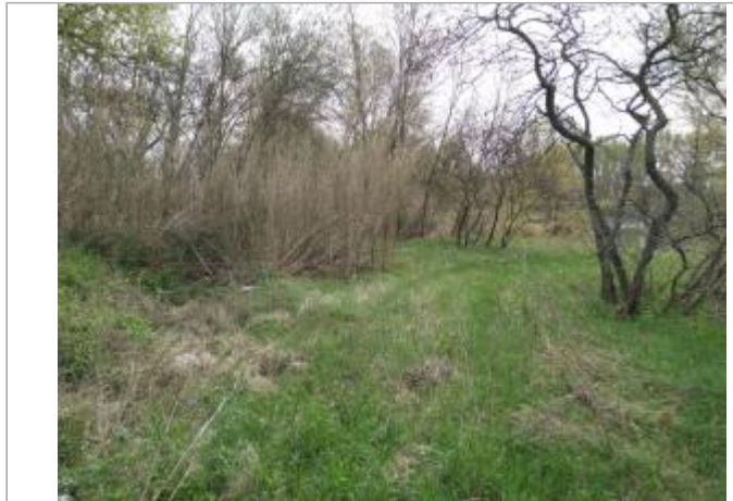
Cannes de provence