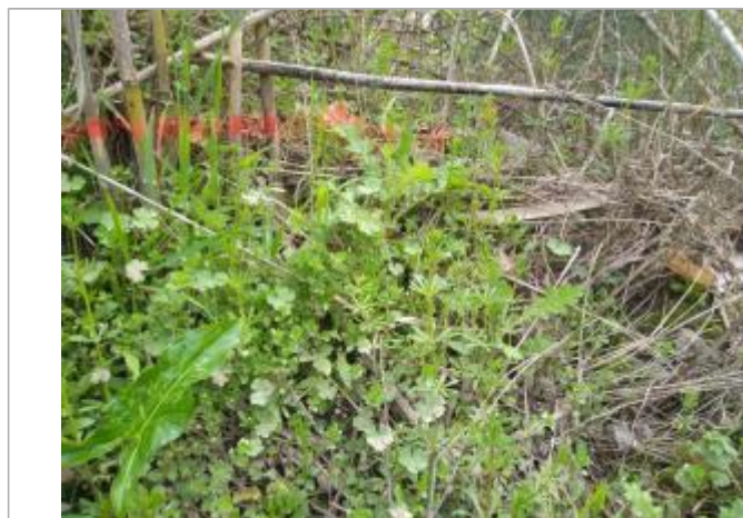
Dépôt contre les cannes de Provence

Maximum de l'inondation : Oui Visibilité : Non renseigné État du repère : Non renseigné Pérennité : Non renseigné Repère calculé : Non renseigné PHEC : Non renseigné