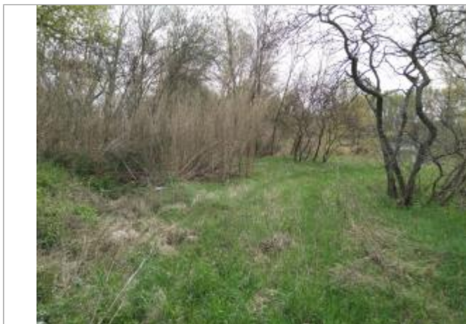
Cannes de provence