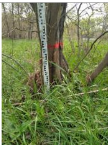
Trace sur l'écorce

Altitude calculée de l'eau (en m) : 25.7