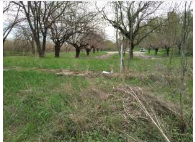
Arbre sur la digue amont du parking

Coordonnées WGS84 : X: 3.13482350 / Y: 43.42331420