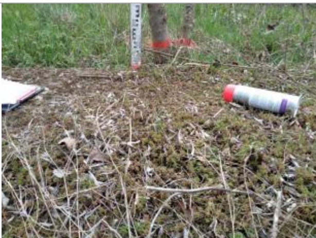
Trace sur l'écorce