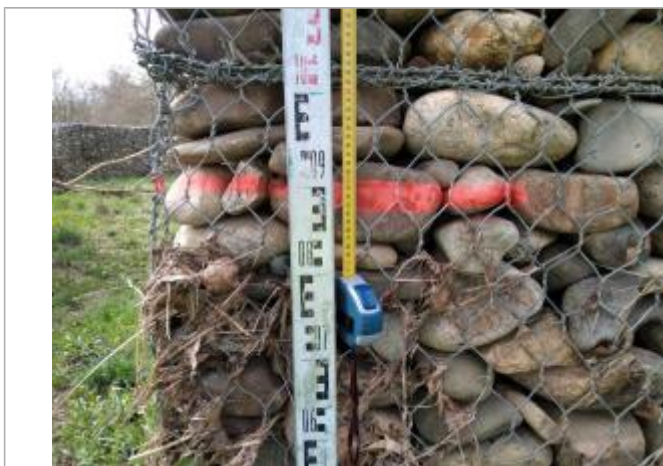
Débris végétaux accrochés aux gabions