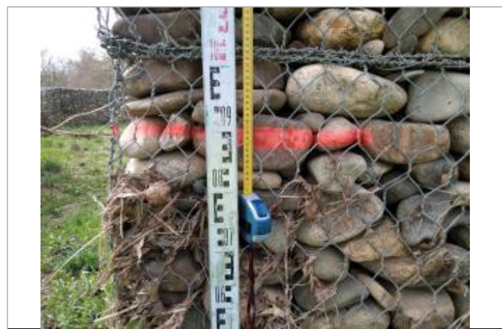
Débris végétaux accrochés aux gabions

GÉNÉRAL Code : 23_ORB22_R_385_1 Date de mise à jour : 26/04/2023 Auteur : SPC MO