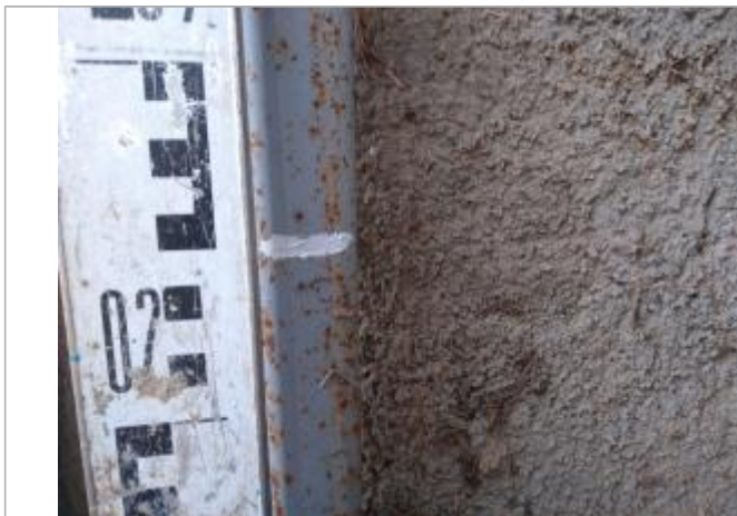
Trace dans l'ouvrage