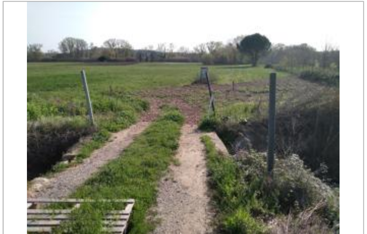
Chemin d'accès au champ

Coordonnées WGS84 : X: 3.16248760 / Y: 43.37385020