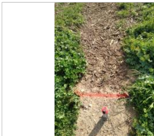
Dépôt sur le chemin