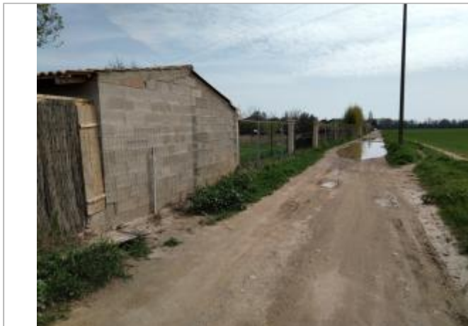
Mur du cabanon