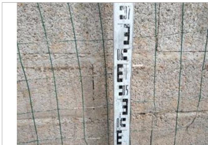
Trace sur le mur en parpaings

Altitude calculée de l'eau (en m) : 18.141