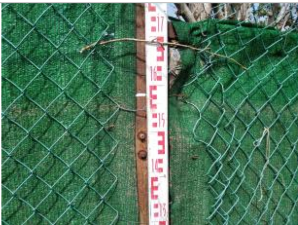
Trace sur le portail

Altitude calculée de l'eau (en m) : 17.82