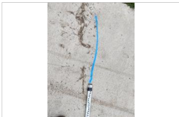
Dépôt sur la piste / 16,5m sur échelle limni pile gauche du pont