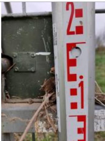
Trace sur le portail