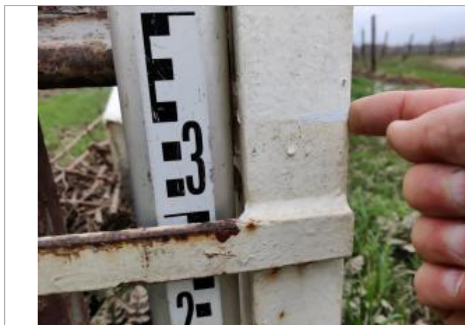
Trace sur le pied de la barrière

Altitude calculée de l'eau (en m) : 15.628