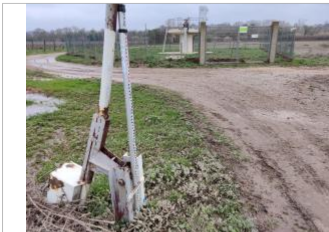
Barrière puits N°10

Coordonnées WGS84 : X: 3.18305470 / Y: 43.36115980