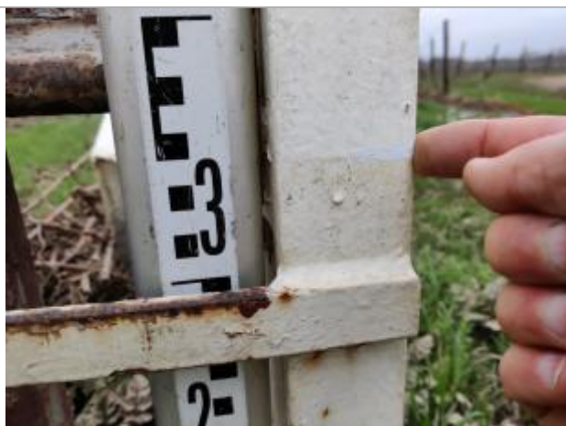
Trace sur le pied de la barrière

Altitude calculée de l'eau (en m) : 15.628