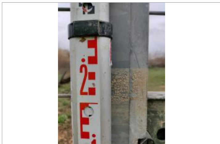
Trace sur le portail