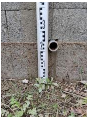
Trace sur le mur