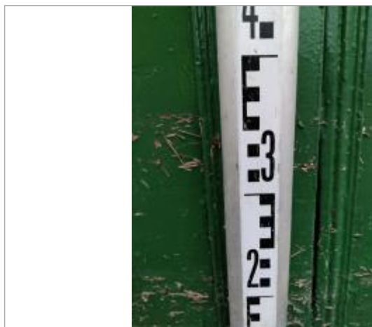
Trace sur le portail