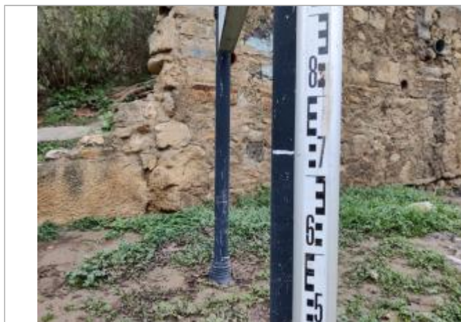
Trace sur le poteau