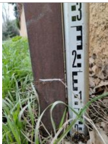
Trace sur le poteau