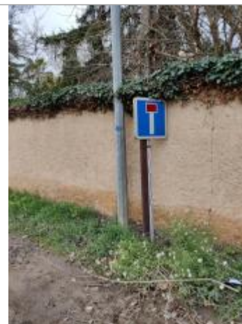
Poteau du panneau impasse