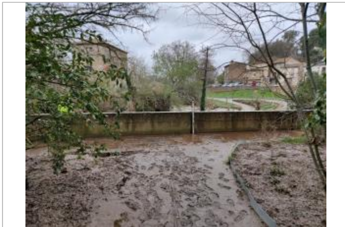
Mur de rive