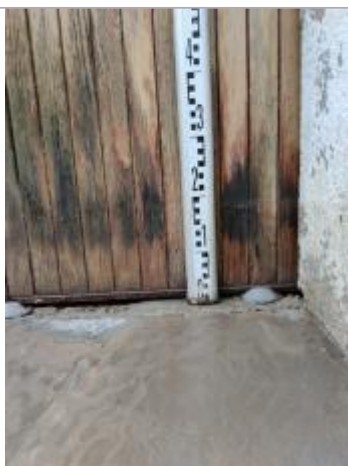
Trace sur le portail