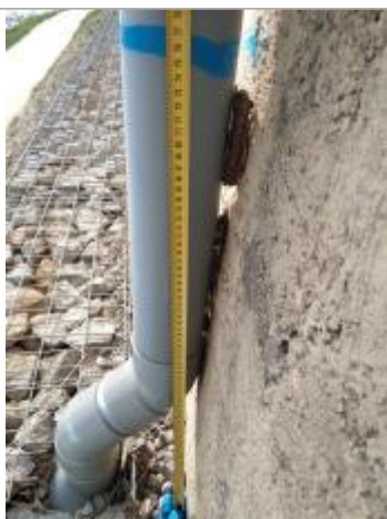
Débris végétaux coincés dans la gouttière