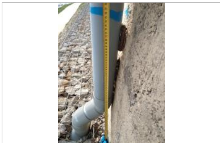
Débris végétaux coincés dans la gouttière