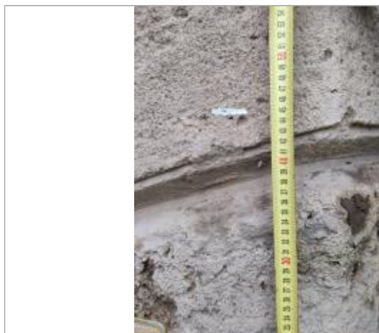
Trace sur l'arche