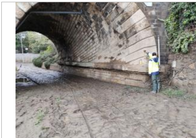
Arche de pont