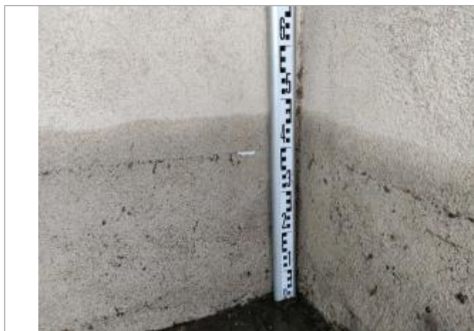
Trace sur le mur