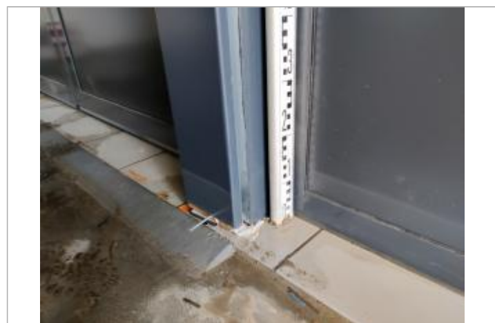
Trace sur la vitre