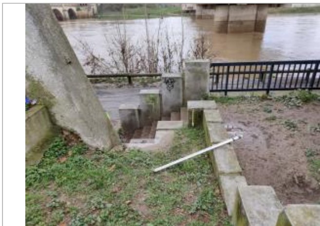
Muret des escaliers