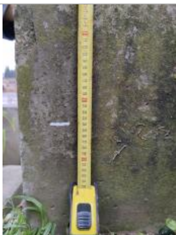
Trace sur le muret