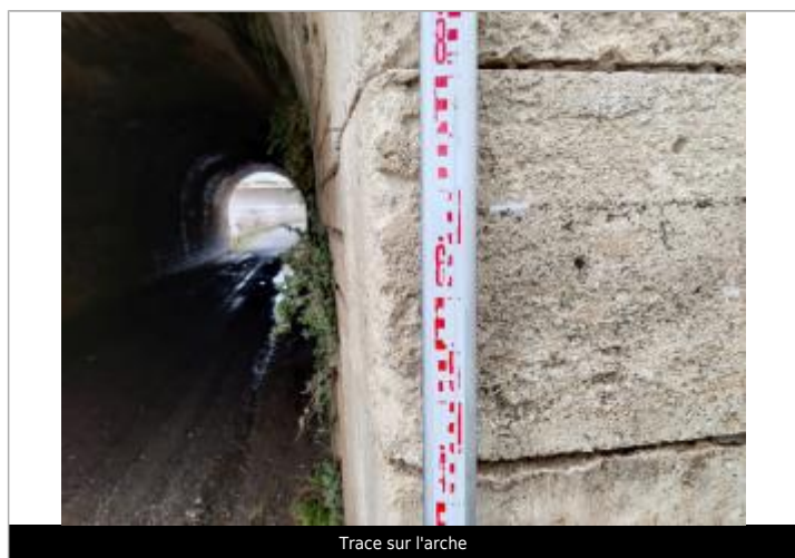
Trace sur l'arche

Maximum de l'inondation : Oui Visibilité : Non renseigné État du repère : Non renseigné Pérennité : Non renseigné Repère calculé : Non renseigné PHEC : Non renseigné