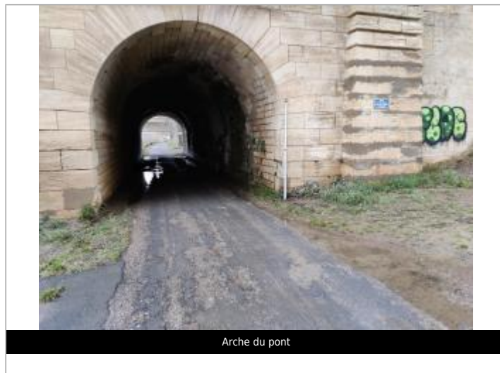
Arche du pont