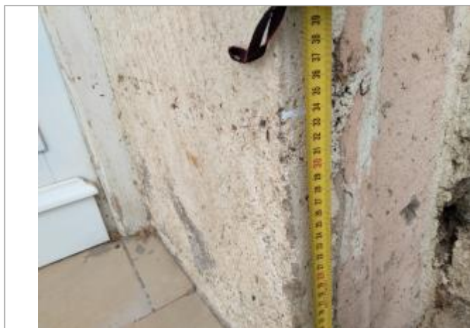
Trace dans l'encadrure