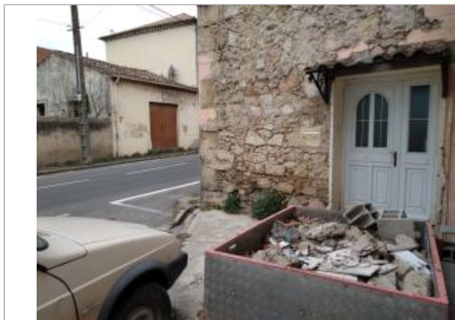
Cadre de porte

Coordonnées WGS84 : X: 3.20921630 / Y: 43.33548270