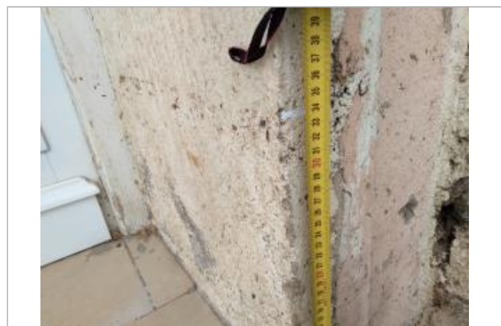
Trace dans l'encadrure

GÉNÉRAL Code : 23_ORB22_R_292_1 Date de mise à jour : 26/04/2023 Auteur : SPC MO