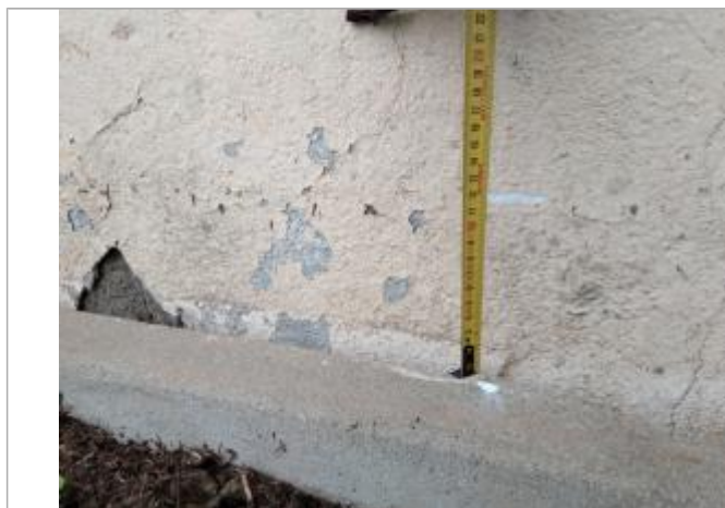
Trace sur le mur