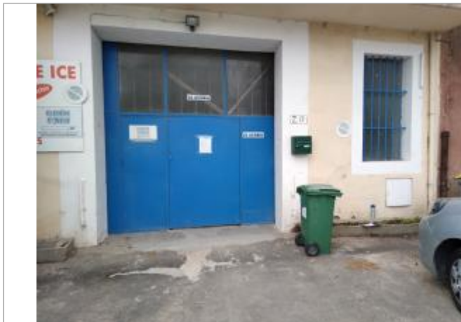
Mur du bâtiment

Coordonnées WGS84 : X: 3.20603290 / Y: 43.33407650