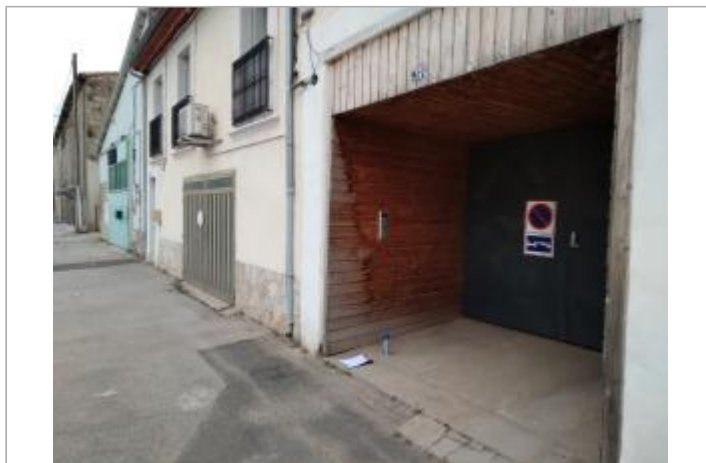
Mur du bâtiment