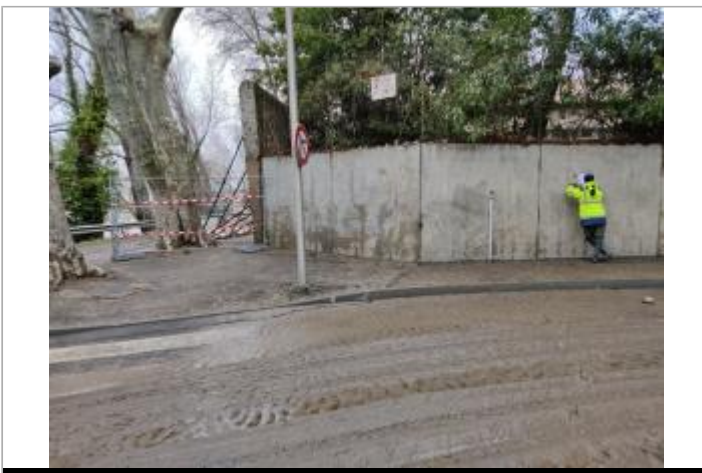
Mur de soutènement

GÉOLOCALISATION Coordonnées WGS84 : X: 3.21122810 / Y: 43.33727800 Coordonnées RGF93 (Lambert 93) : X: 717138.8 / Y: 6248704 Coordonnées RGF93 (ETRS89) : X: 3.2112281 / Y: 43.337278 Code Hydro: Y25-0400 Rive de référence: Gauche