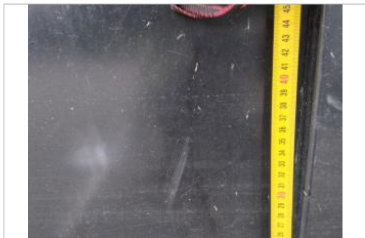
Trace sur le portillon

Altitude calculée de l'eau (en m) : 12.108