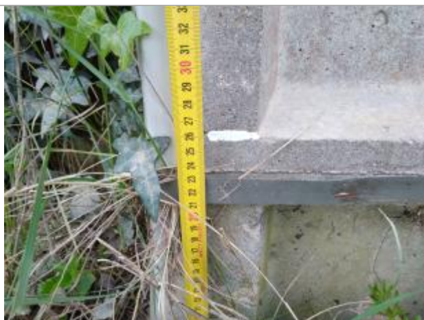
Trace sur le pylône

Altitude calculée de l'eau (en m) : 12.04