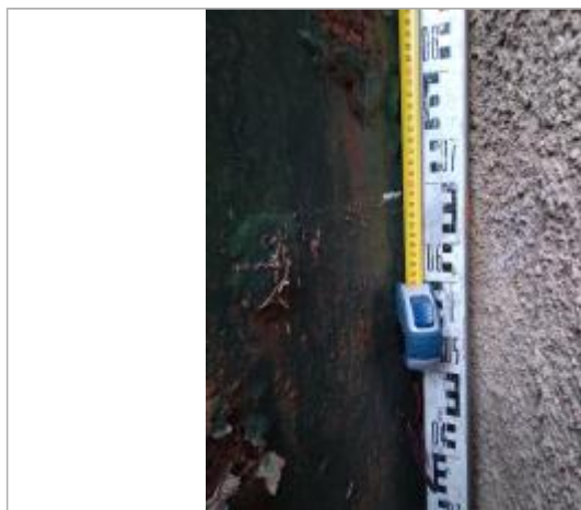
Trace sur le portail