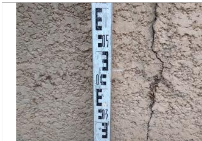
Trace sur le muret