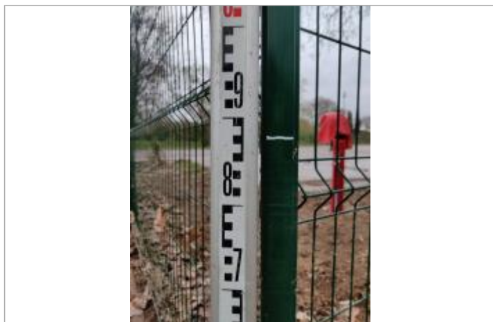
Trace sur le piquet