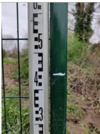
Trace sur le piquet

Altitude calculée de l'eau (en m) : 11.16