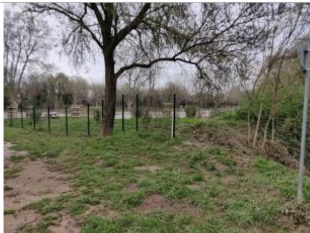
Clôture de l'aire de Sauclières